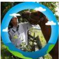
très belle photo