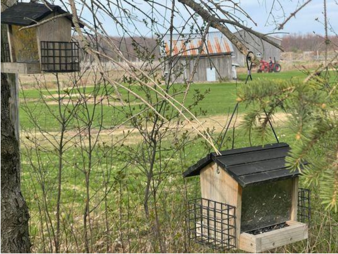
Madame se repose